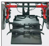
●ベントトレイ(オプション)