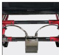
●フットペダルブレーキ(オプション)