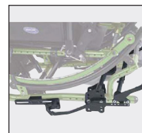
●フットプッシュブレーキ(オプション)